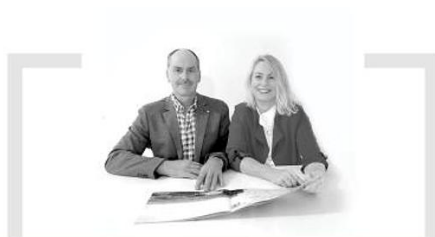
Weidinger Wohnbau, Bauunternehmen, Deining „Sicherheit und kompromisslose Qualität.“