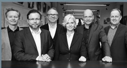
Berschneider + Berschneider, Architekten BDA + Innenarchitekten „Anspruchsvolle Architektur aus einem Guss.“

Wir verwandeln Träume in Bauwerke – durch Planung, Inspiration, Handwerk und Know-how – und sind Ihr zuverlässiger Partner.