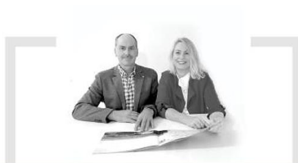
Weidinger Wohnbau, Baunternehmen, Deining „Sicherheit und kompromisslose Qualität.“