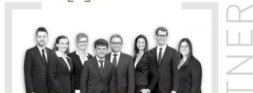
Kirsch & Häubner Immobilien, Neumarkt „Sie entscheiden – wir kümmern uns um den Rest!“