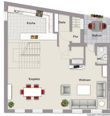
Exemplarplan, nicht maßstäblich