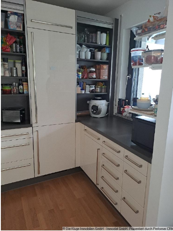
© Die Kluge Immobilien GmbH - Immodat GmbH. Präsentiert durch Perforce CRM