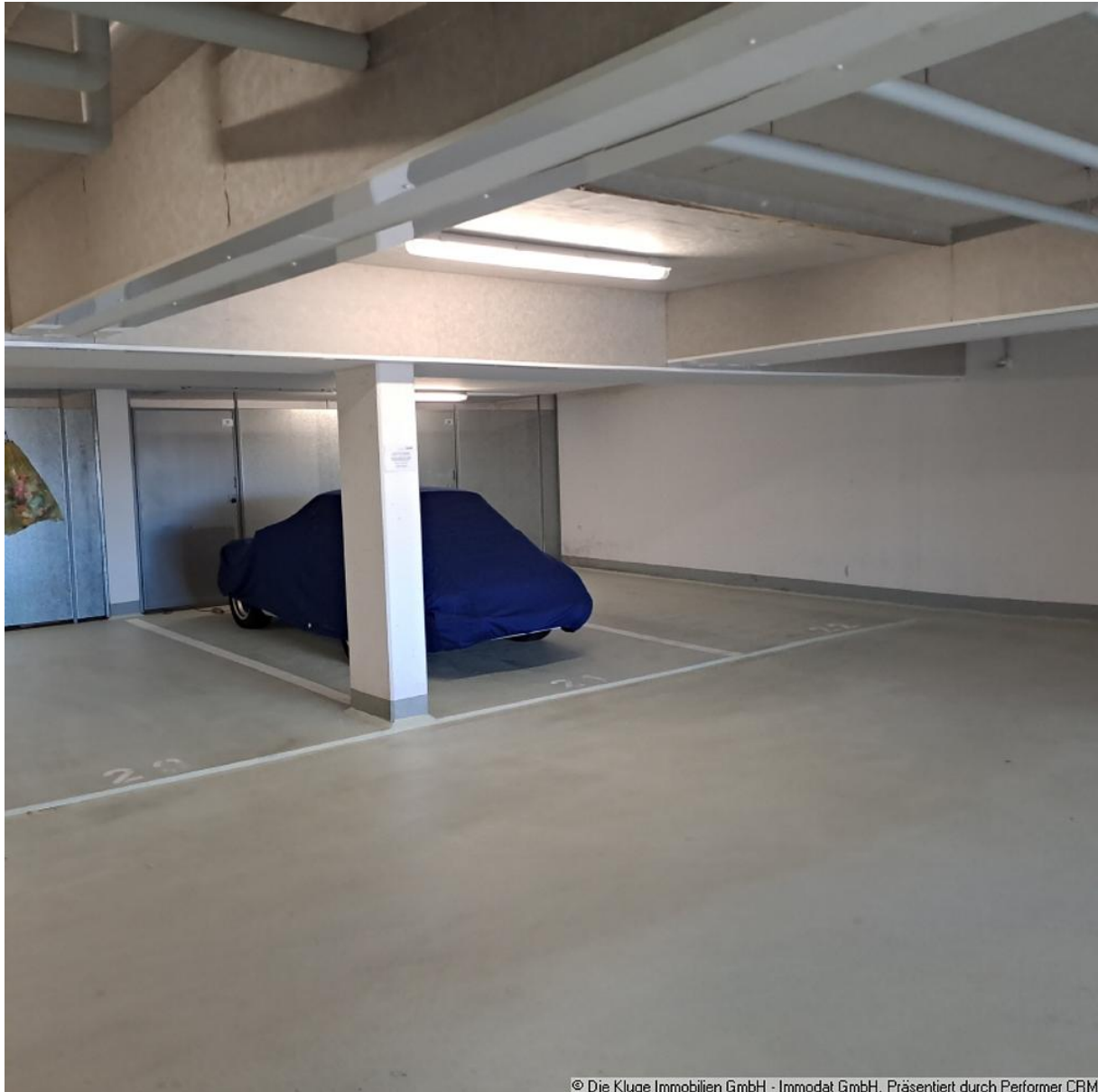
© Die Kluge Immobilien GmbH - Immodat GmbH. Präsentiert durch Performer CRM