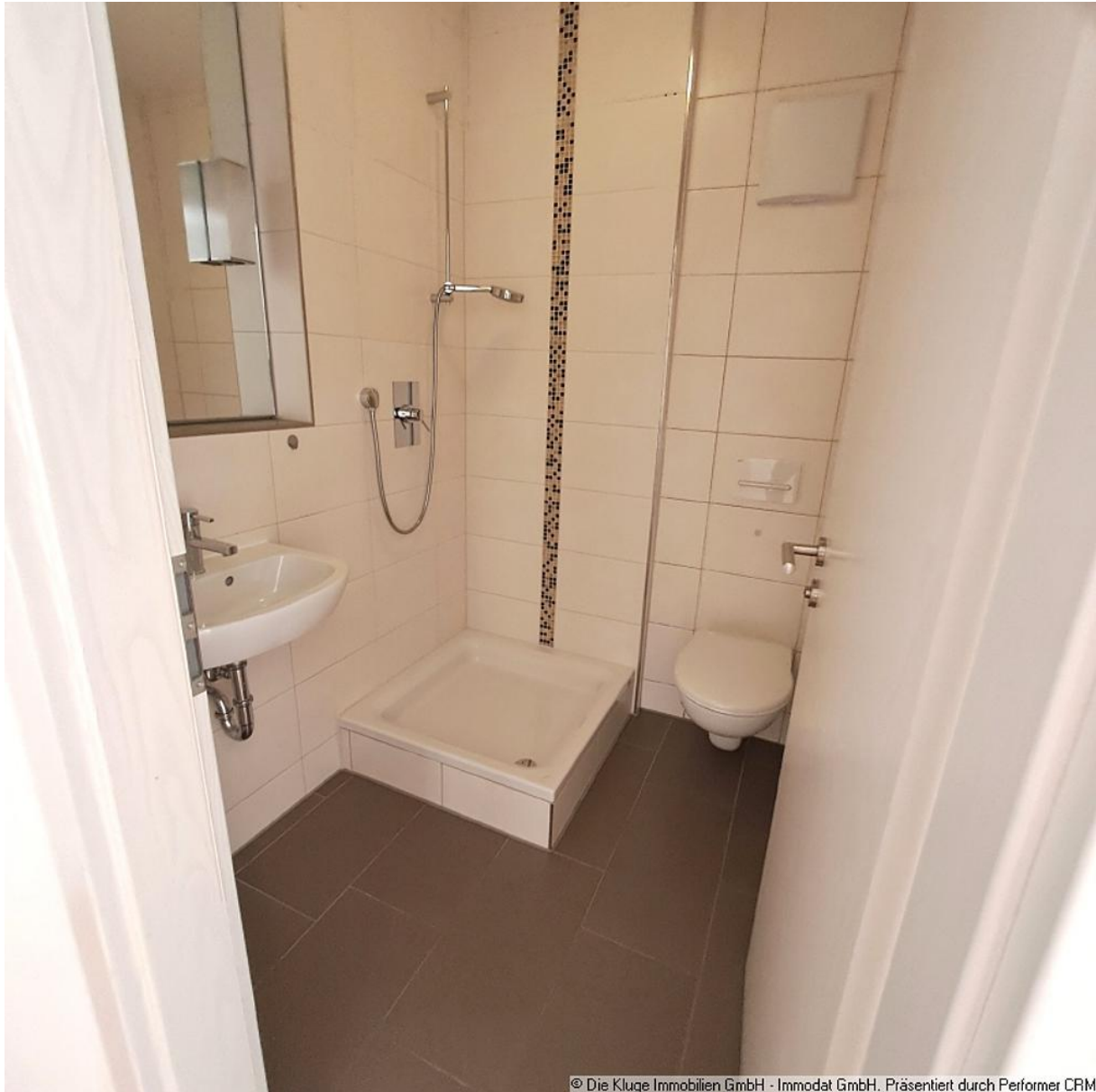
© Die Kluge Immobilien GmbH - Immodat GmbH. Präsentiert durch Performer CRM